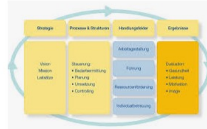
Unternehmenskultur und Gesundheitsmanagem... aeh.ch