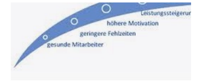
BGM für Firmen physiotrainingbuchs.ch