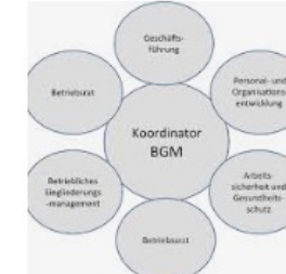
Informieren: Was ist BGM | S... link.springer.com