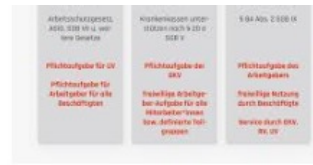
Was ist Betriebliches Gesundheitsm... windhund.com