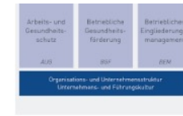
BGM - was ist Betriebliches ... revitalis-gmbh.de