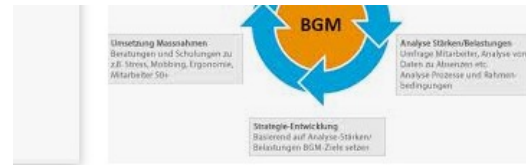
Betriebliches Gesundheitsmanagement - Wie ange... bgm-ag.ch