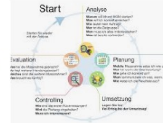
Umsetzung BGM (Personal) Finanzdire... fin.be.ch