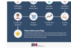
Warum Betriebliches Gesu... ifm-business.de