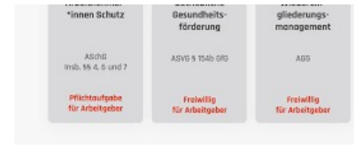
Was ist Betriebliches Gesundheitsmanagement... windhund.com