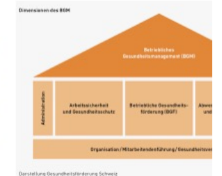
Betriebliches Gesundheitsmanager omnisbusiness.ch